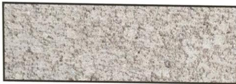
grau, V 62