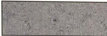
dunkelgrau, V 86