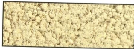
gelb, V 23 B