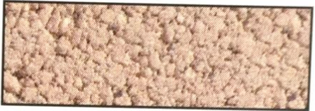
terracotta, V 49