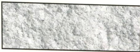
weiß, V 101