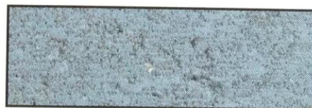
blau, V 77 A