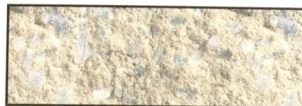
sandstein, V 113*