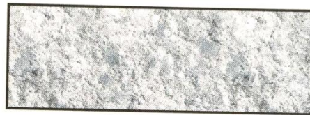
weiß, V 111*