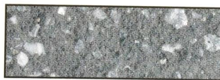
dunkelgrau, V 117*