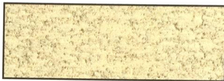
gelb, V 81