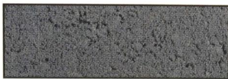
anthrazit, V 87