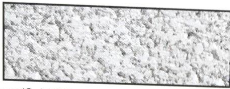
weiß, V 22