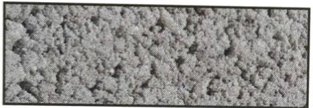
dunkelgrau, V 85