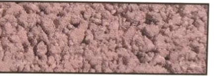
rot, V 56 B