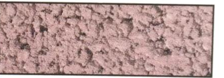
atlasrot, V 38