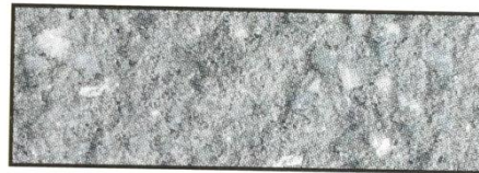
grau, V 110*