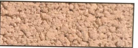
beige, V 96