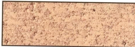
beige, V 50