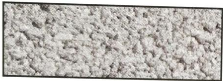
grau, V 51 A