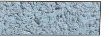
blau, V 11