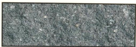
dunkelgrau, V 107