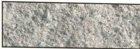
grau, V 100