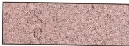
atlasrot, V 98