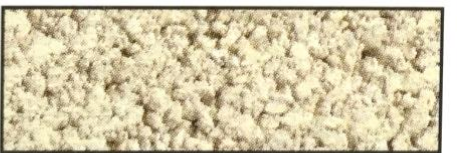
sandstein, V 10