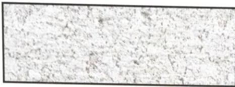
weiß, V 33 A