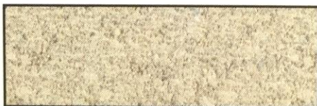
sandstein, V 93