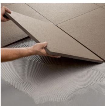
Verklebt mit frostbeständigem flex. Kleber