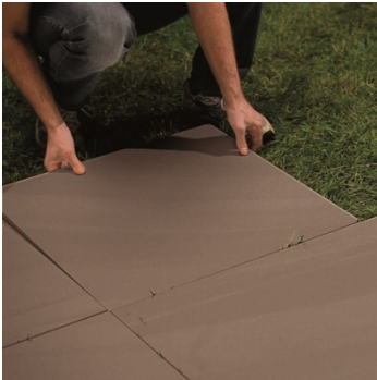
Verlegung auf dem vorhandenen Rasen