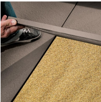
Auf Sand verlegt